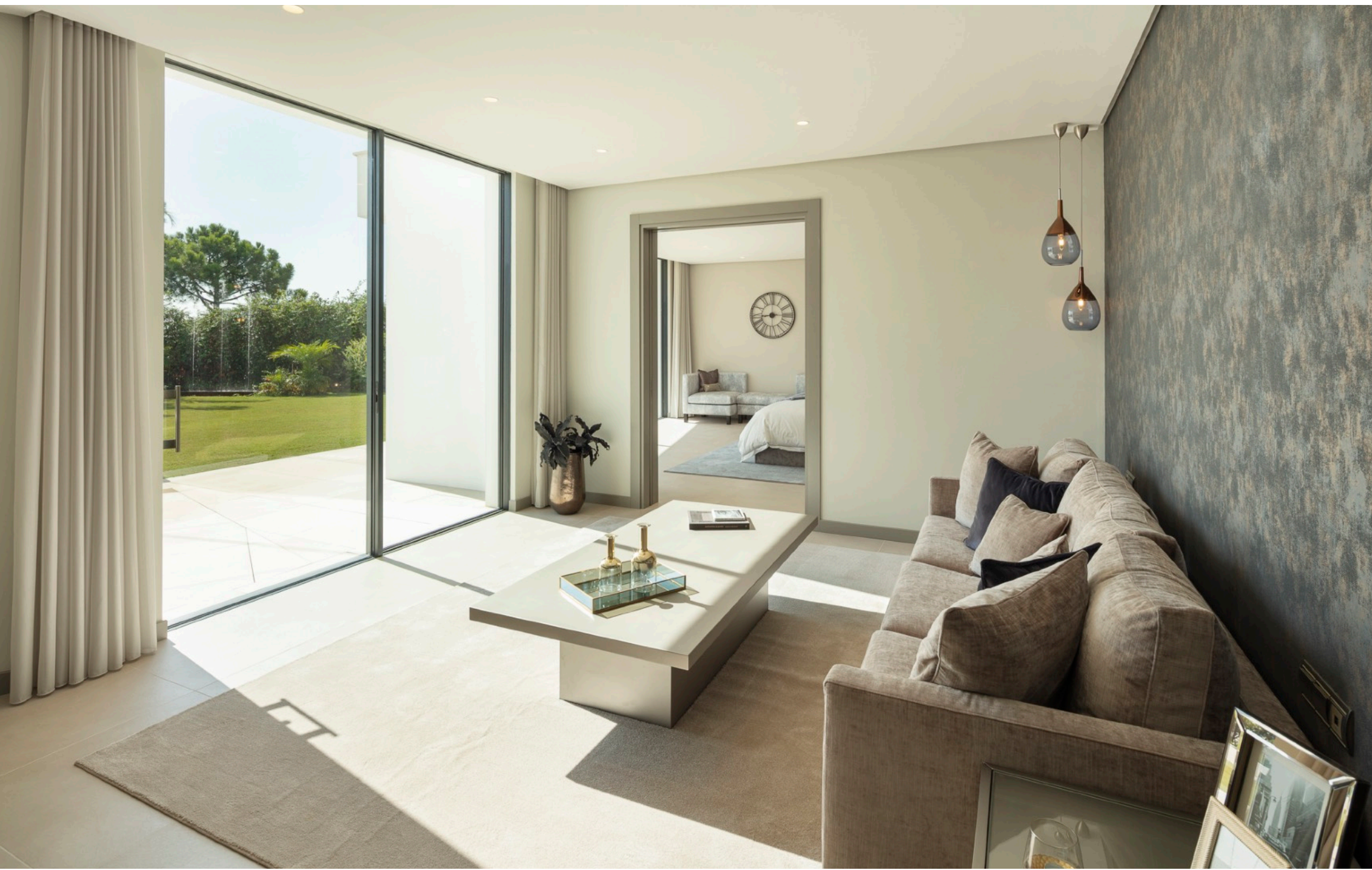
Sala de estar habitación de invitados