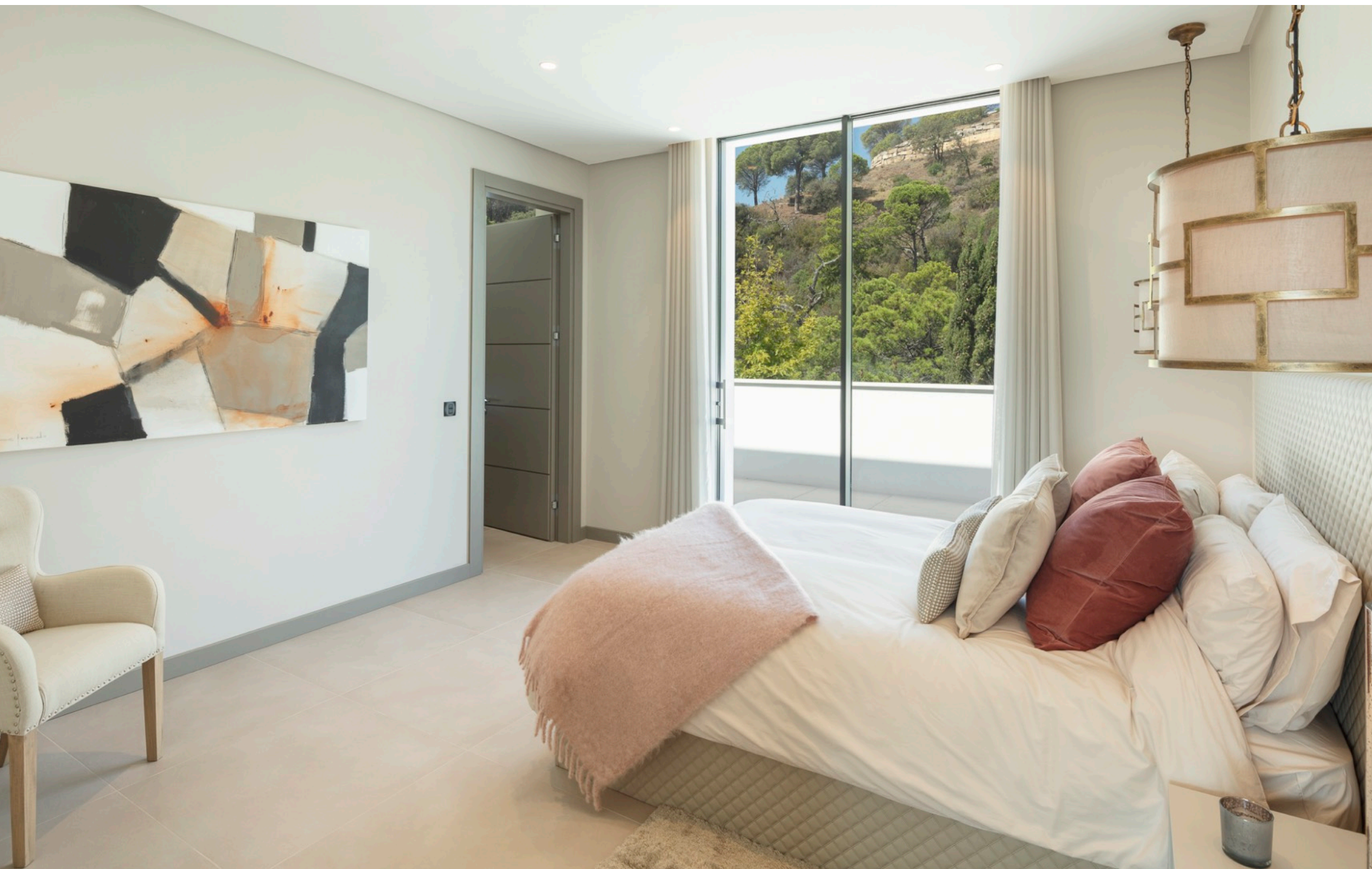
Habitación de invitados