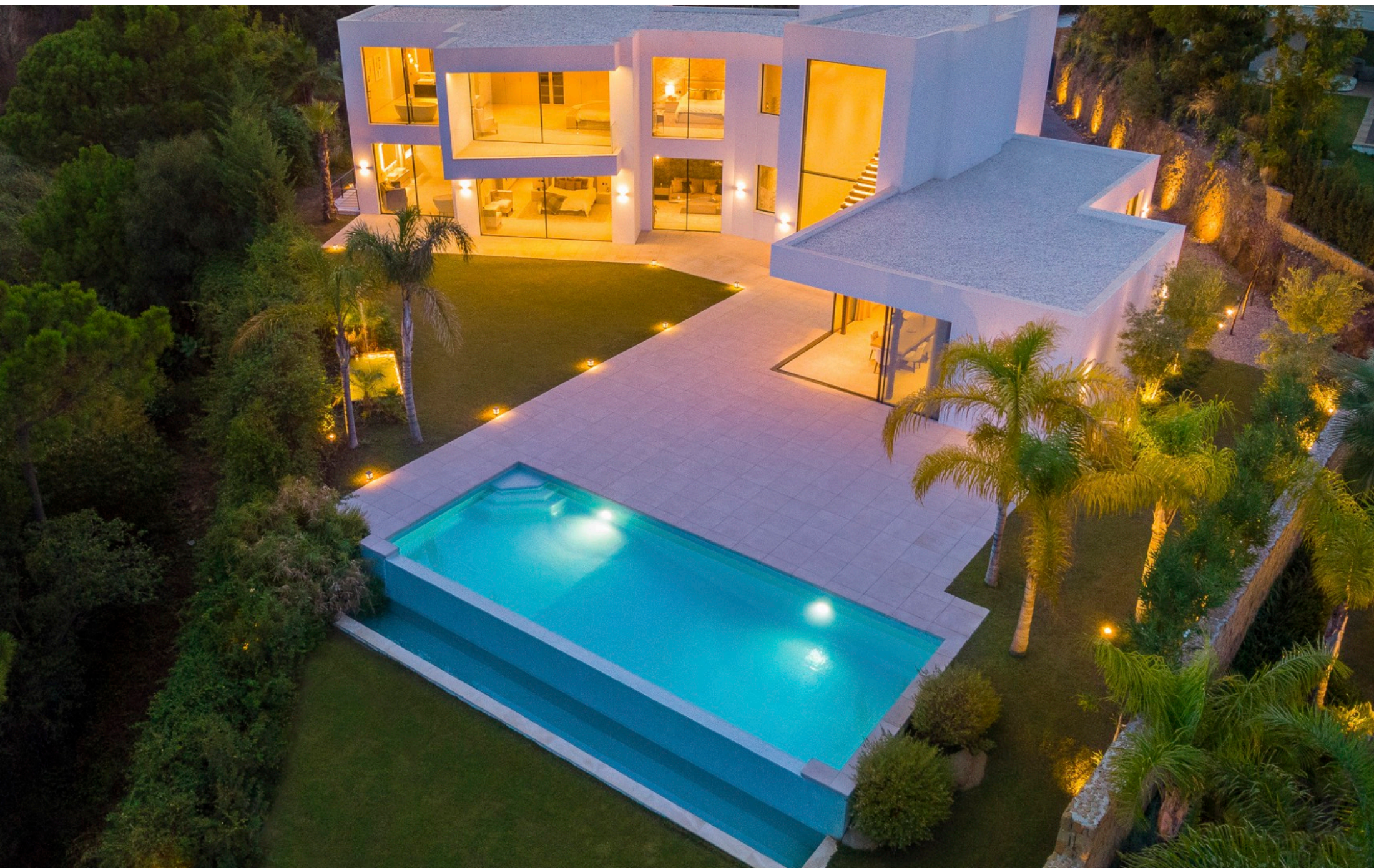
| La casa de noche