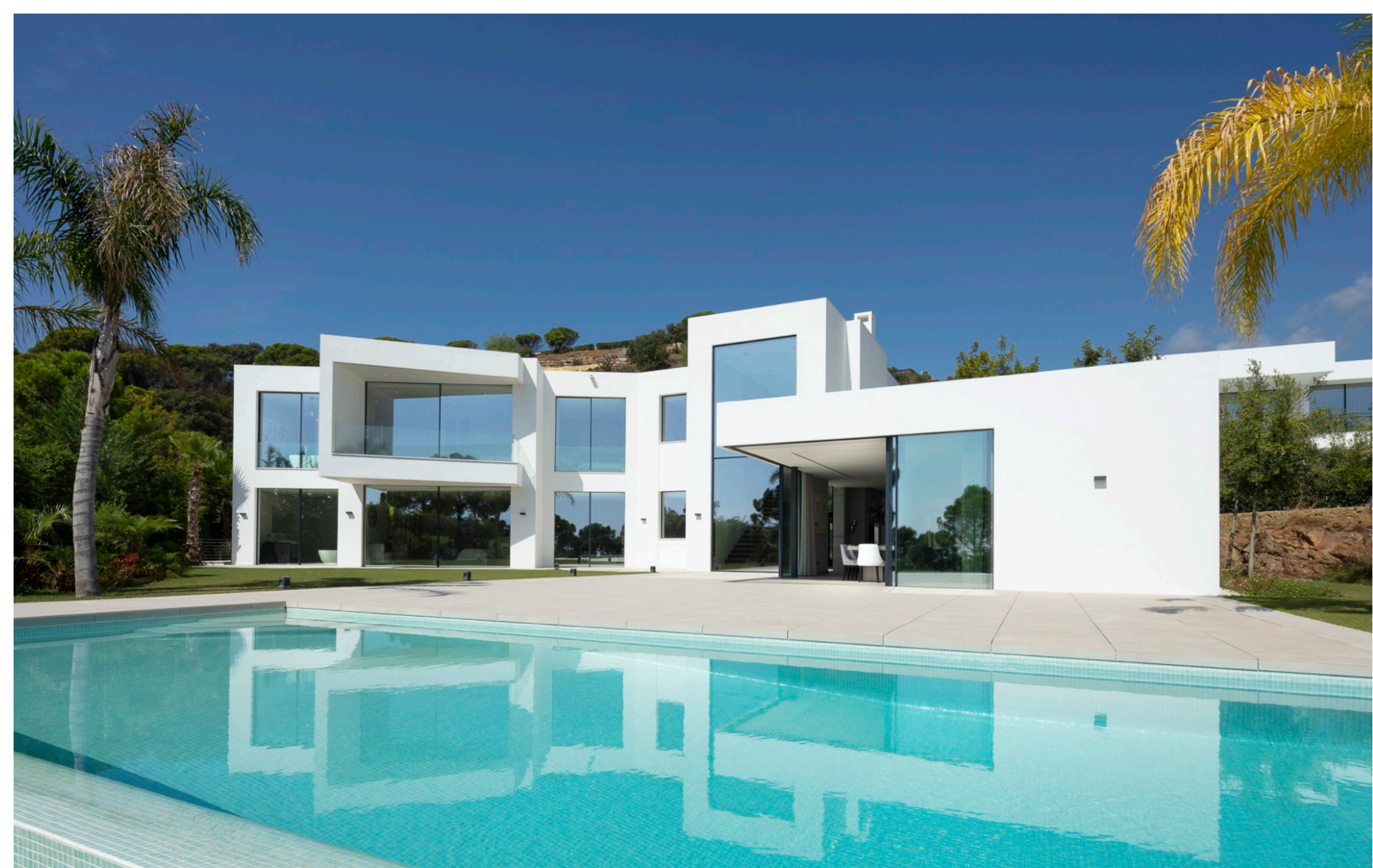
La zona de la piscina