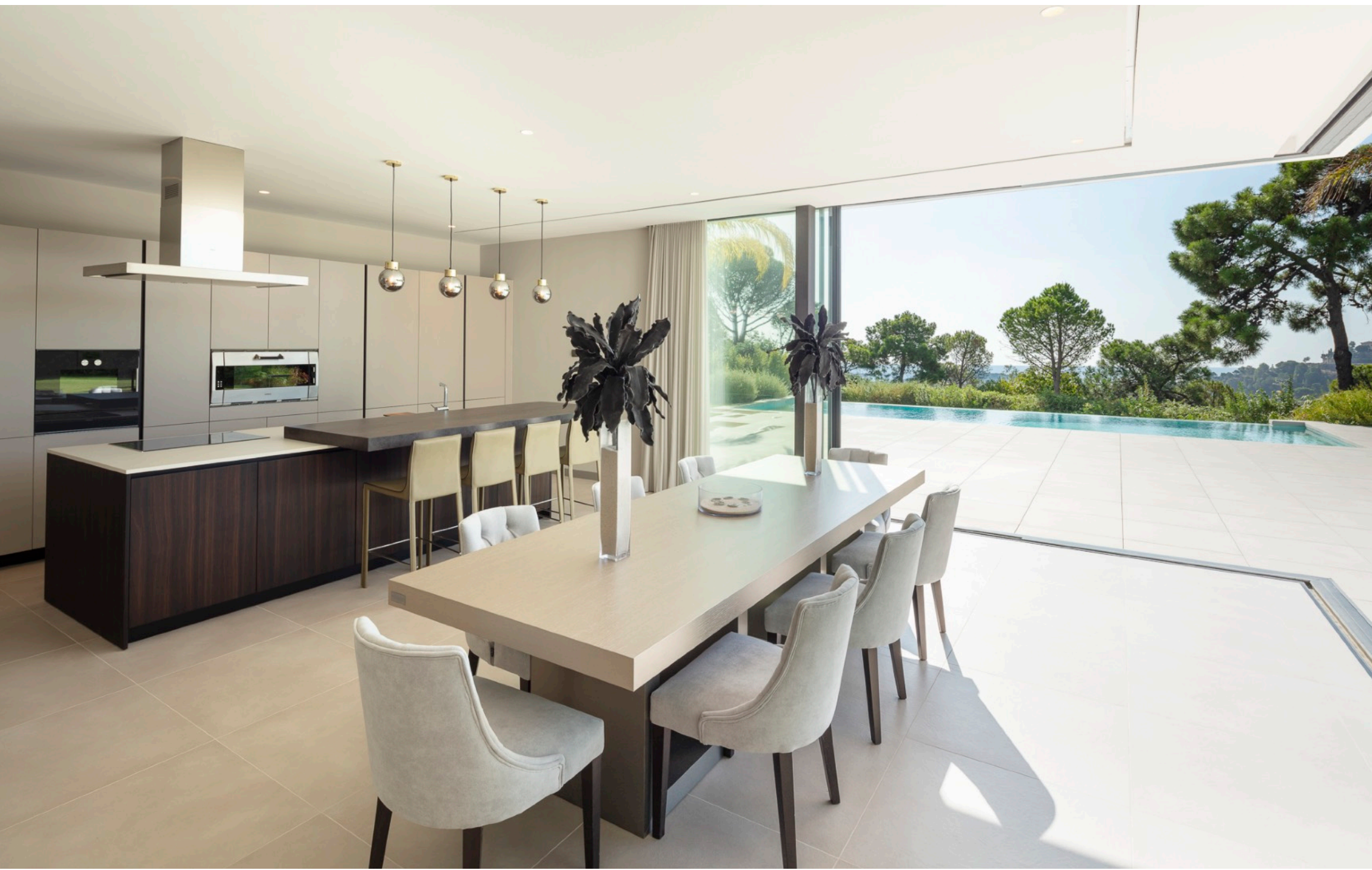
La cocina interior y exterior