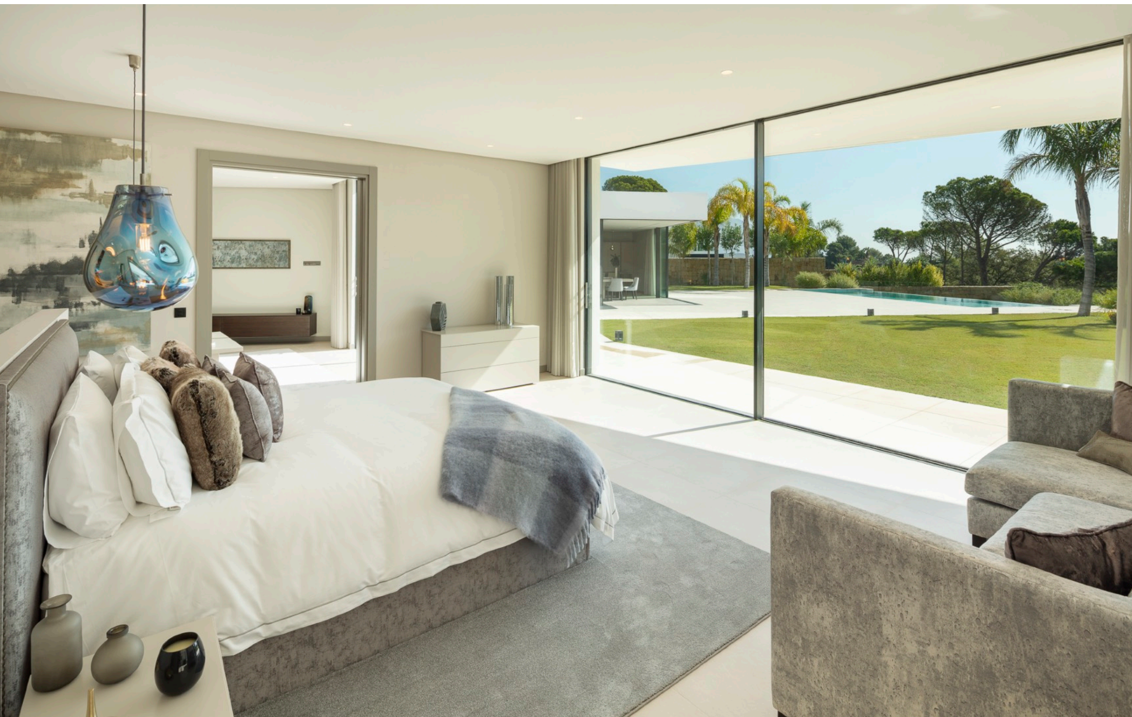
Habitación de invitados