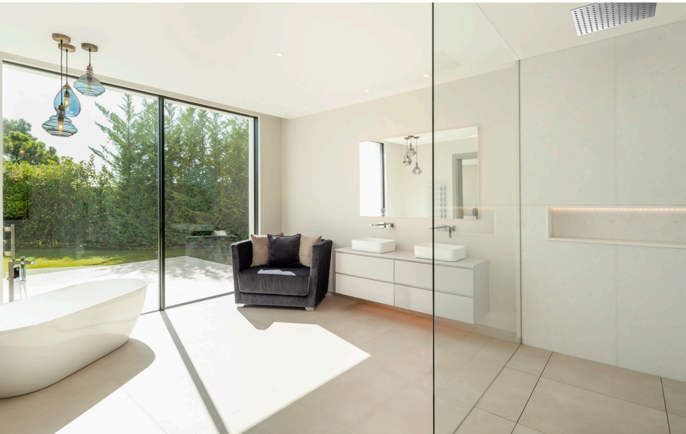
Baño de invitados