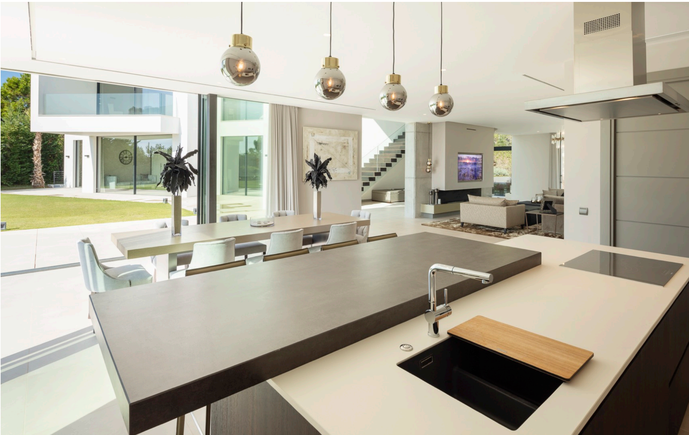
La cocina desde otro angulo