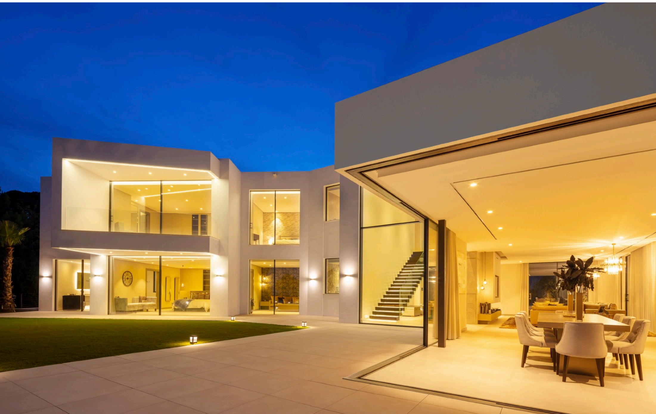
La casa de noche