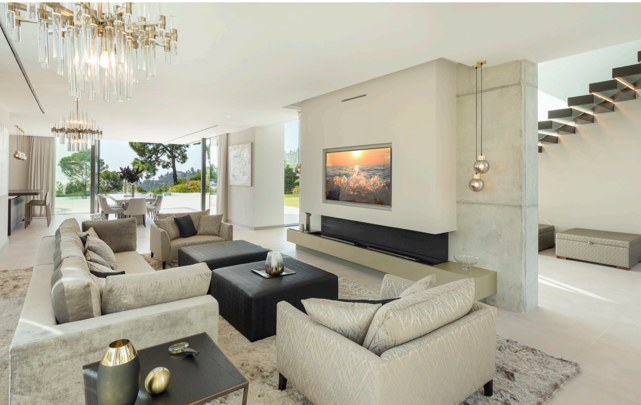
El salon principal