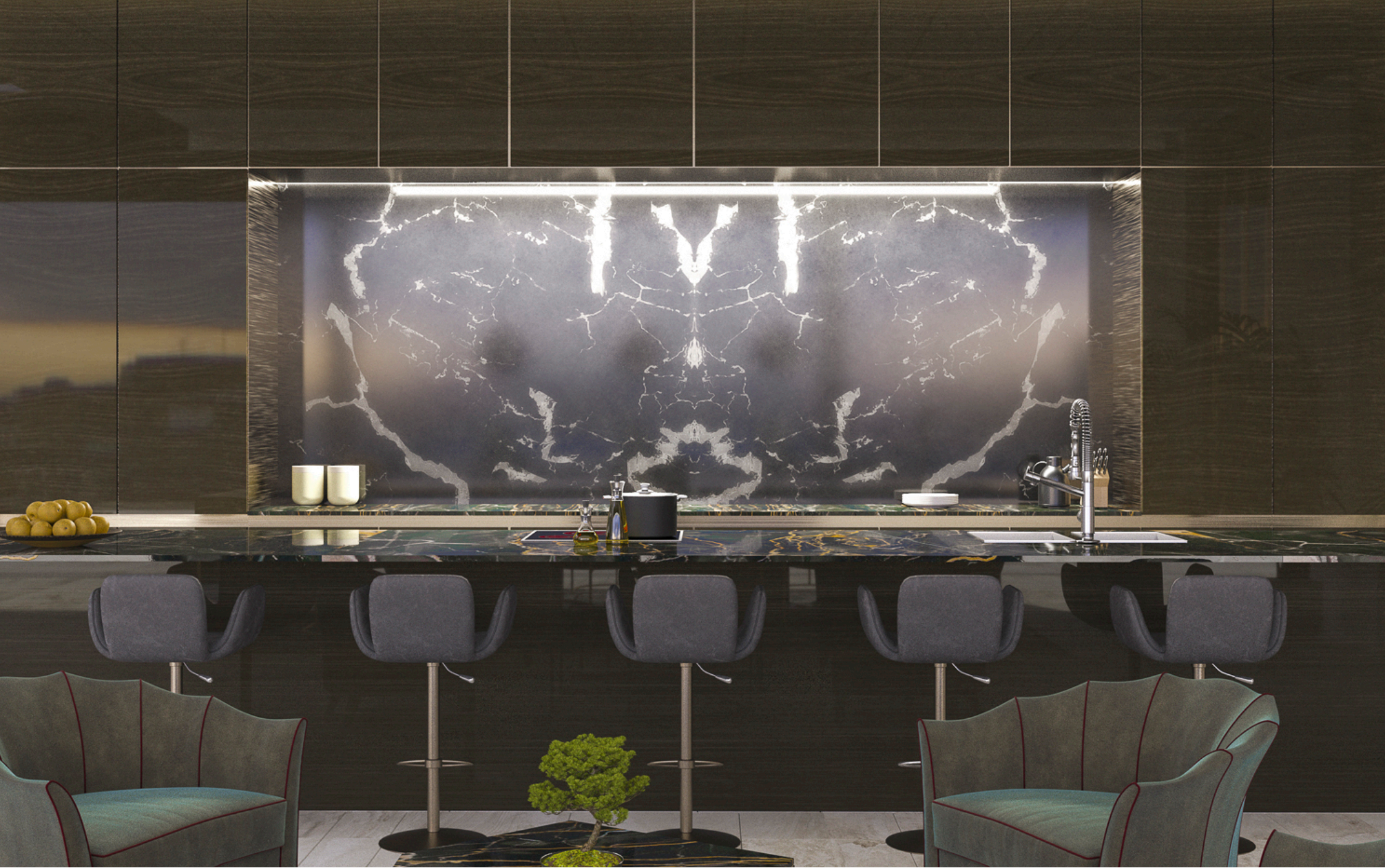
Cocina - Bar