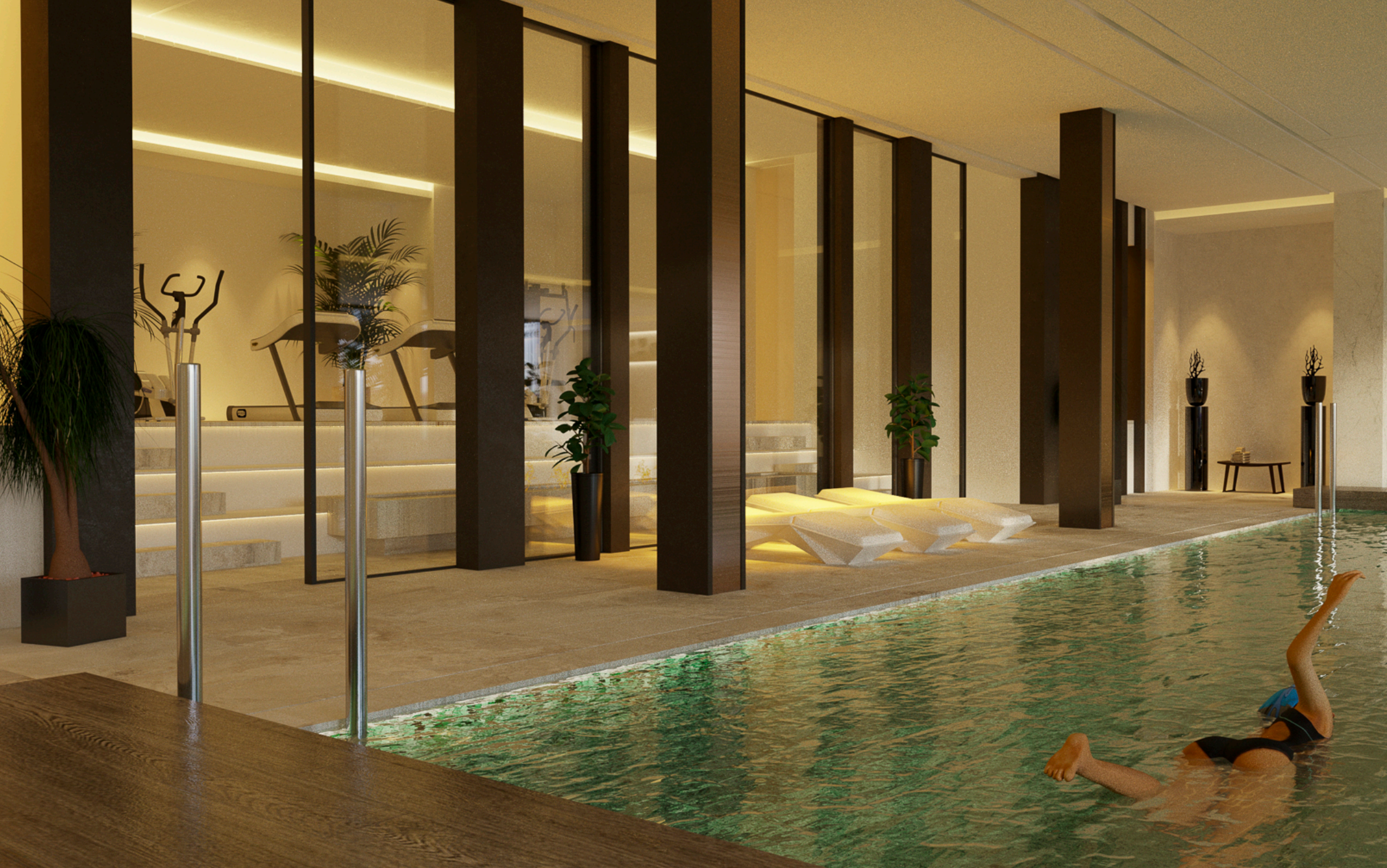
Gimnasio y Piscina