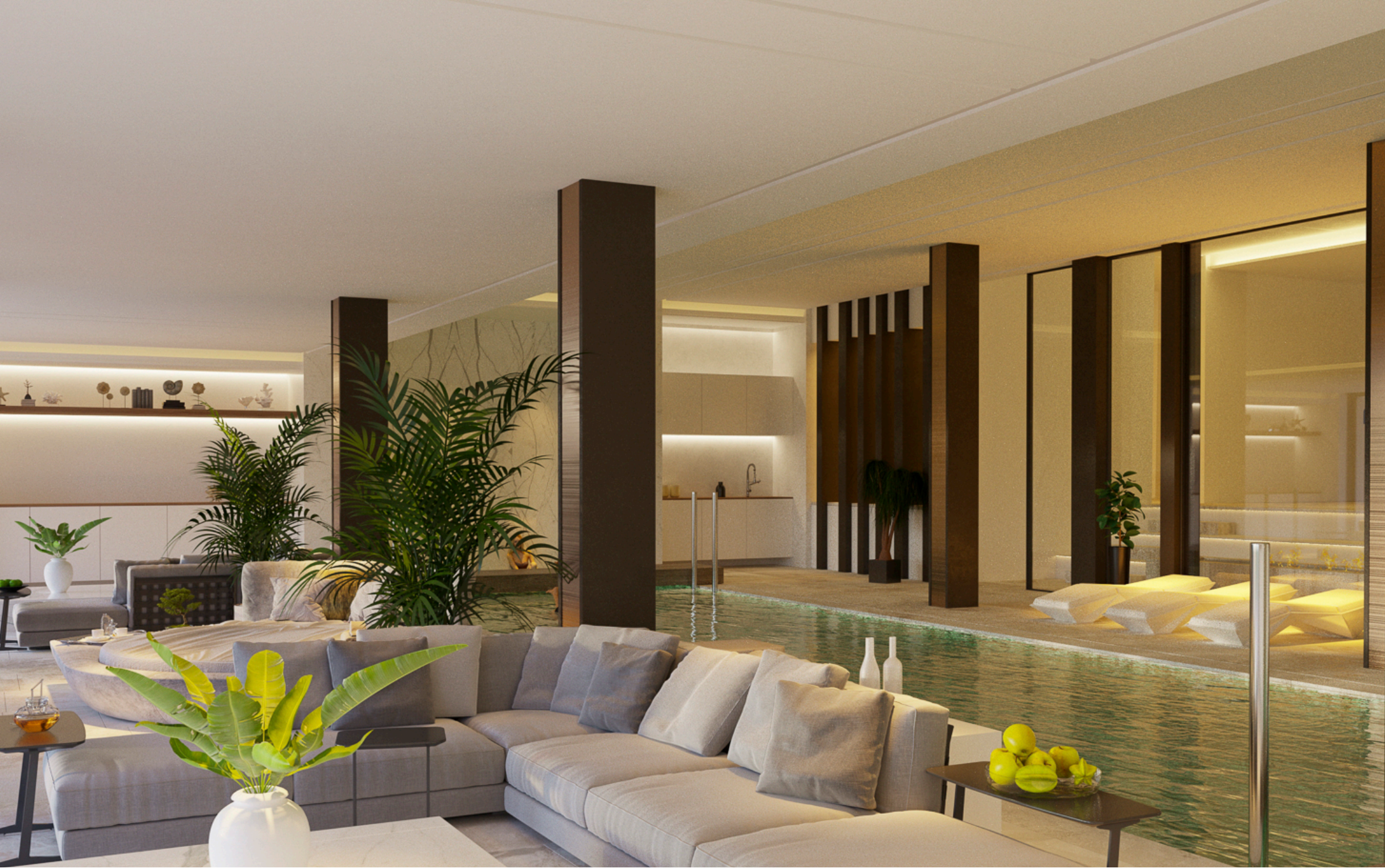
Zona Chill Out junto a la Piscina Interior