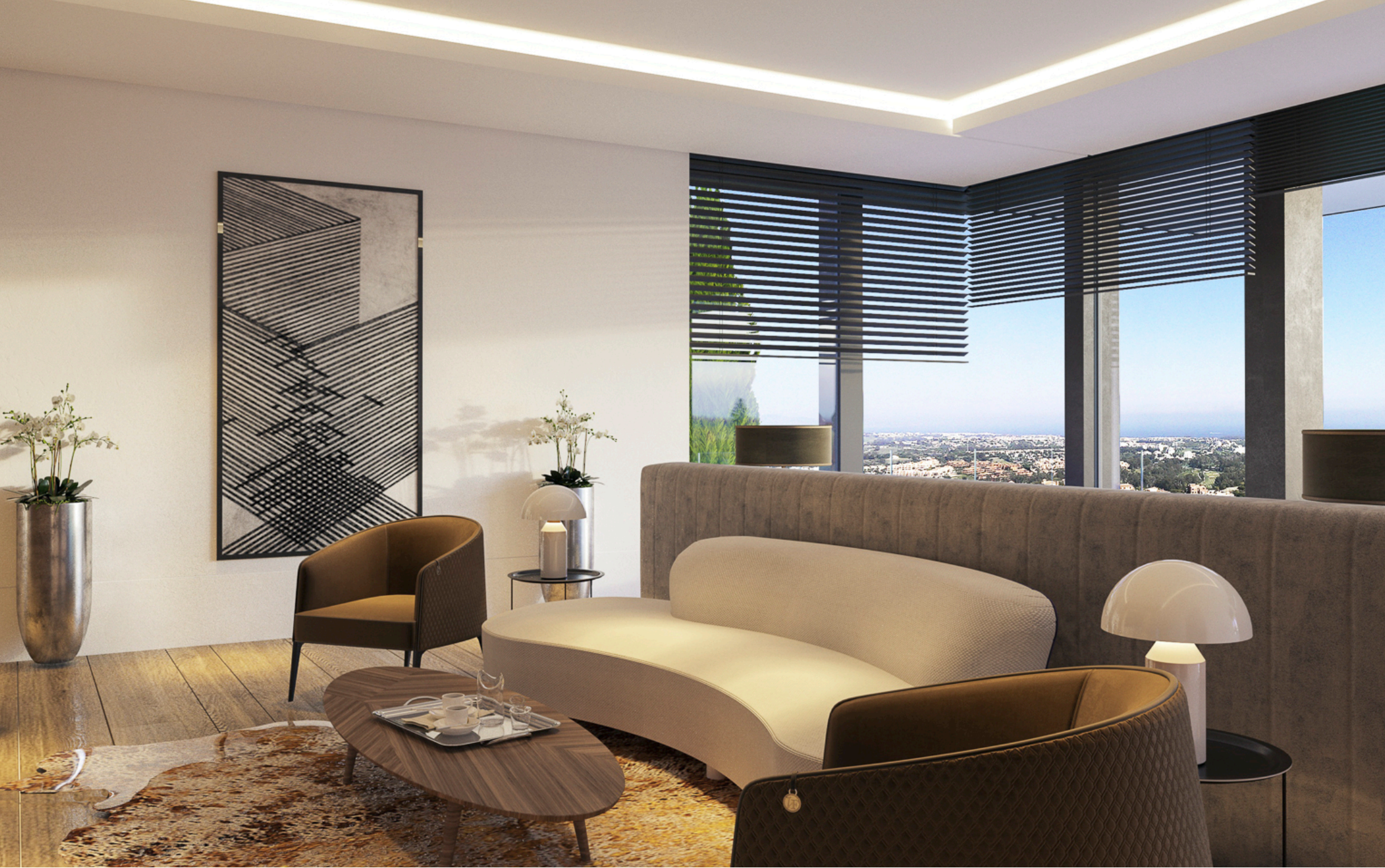
Sala de TV