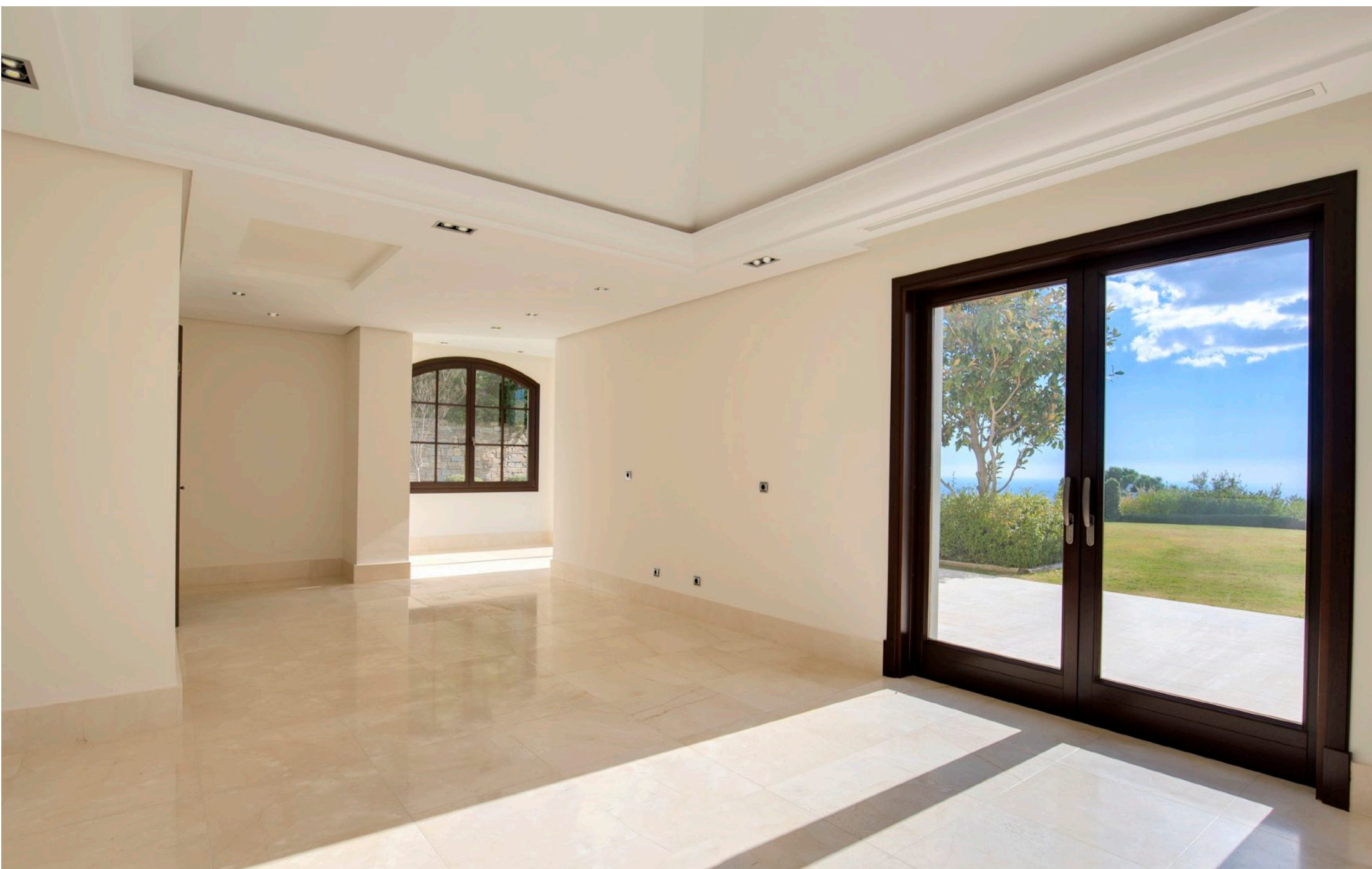
Cocina con Maravillosas Vistas al Mar