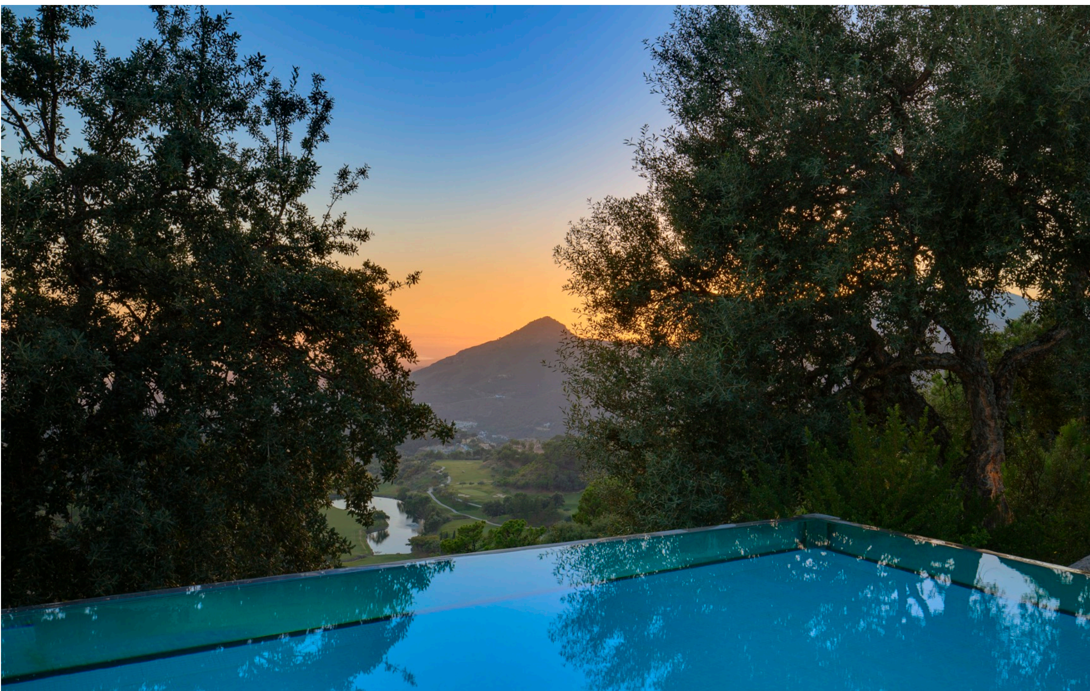
Piscina Exterior en el Paraíso