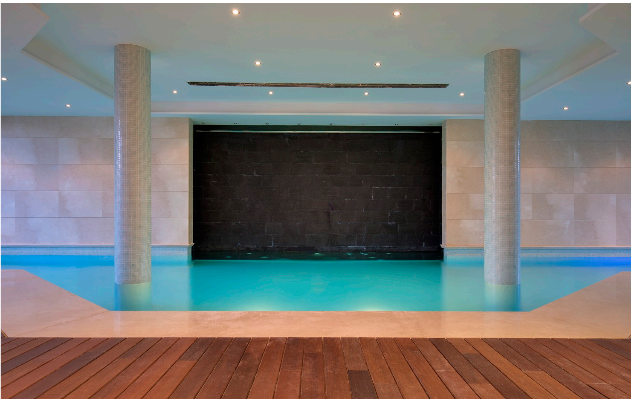
Piscina Interior y Area de Spa