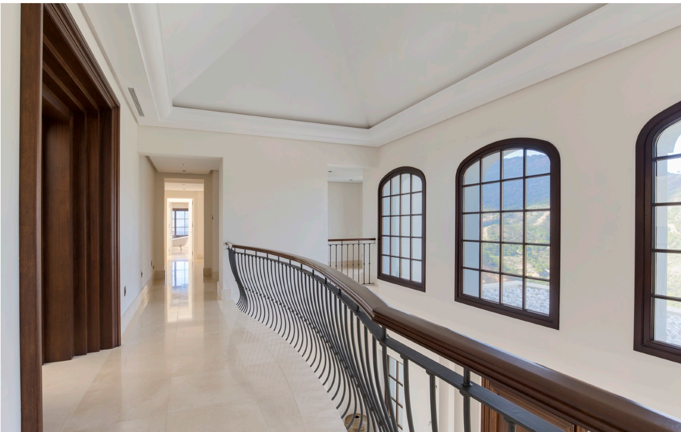
Planta de Arriba