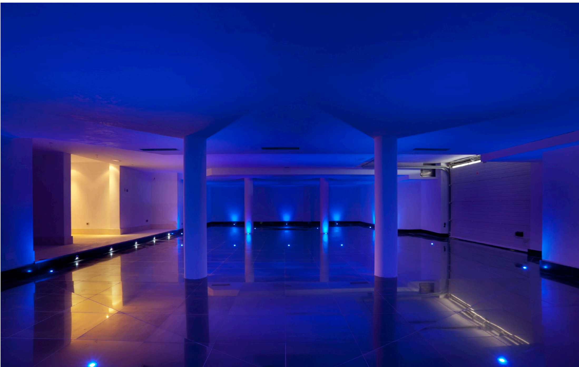
Garaje. Iluminación de Vanguardia y Espacio para 6 Coches