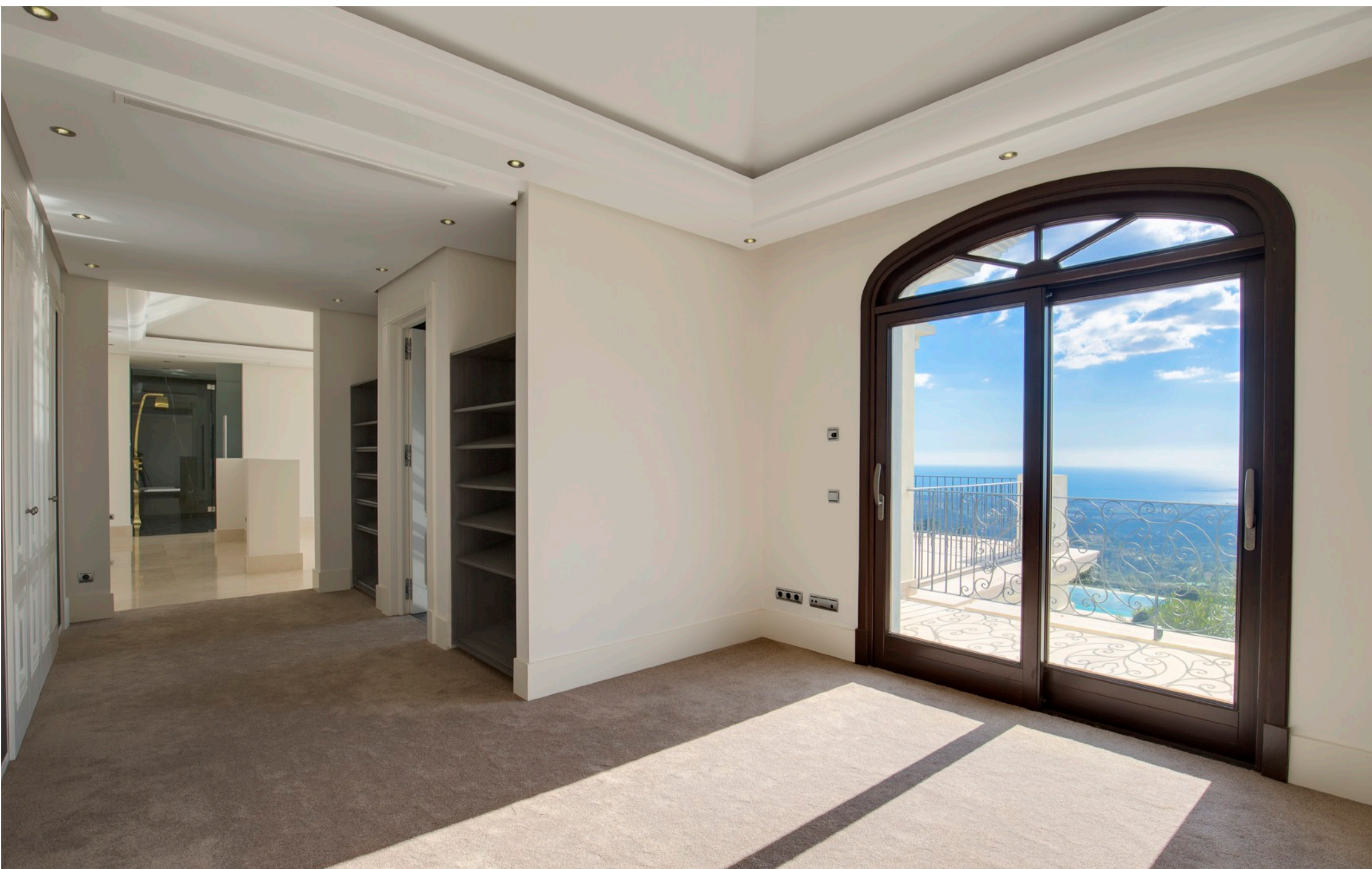
Dormitorio Principal con Acceso Directo a la Terraza Privada