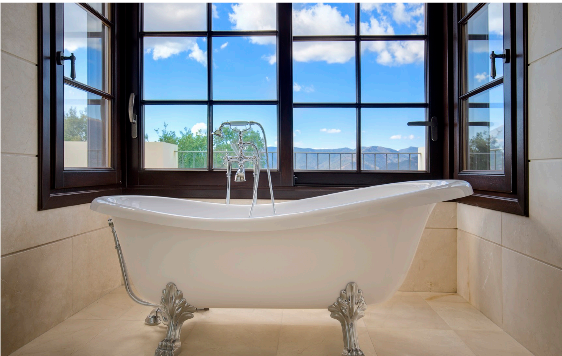
Baño con Vistas