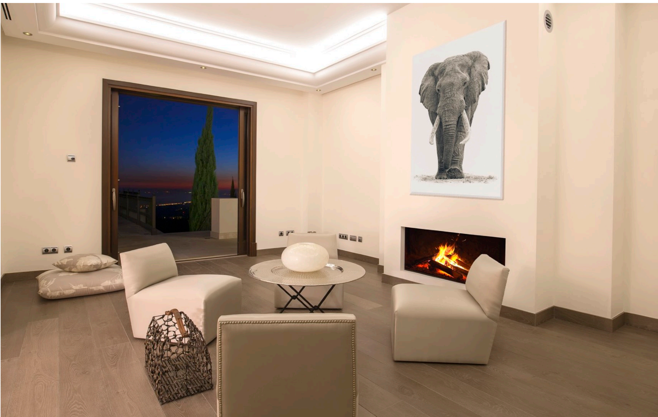
Habitación Chill Out