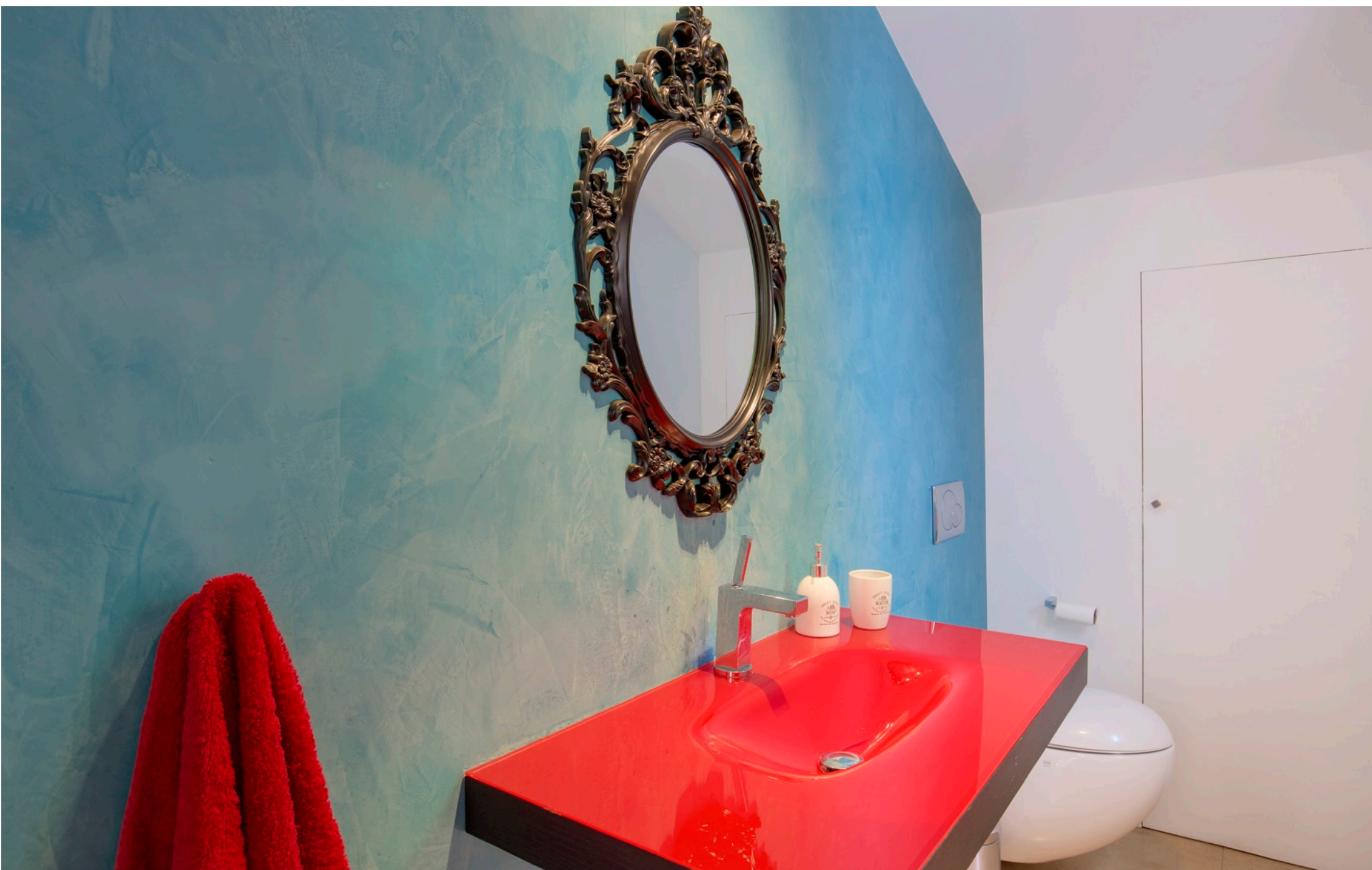
Baño de Invitados