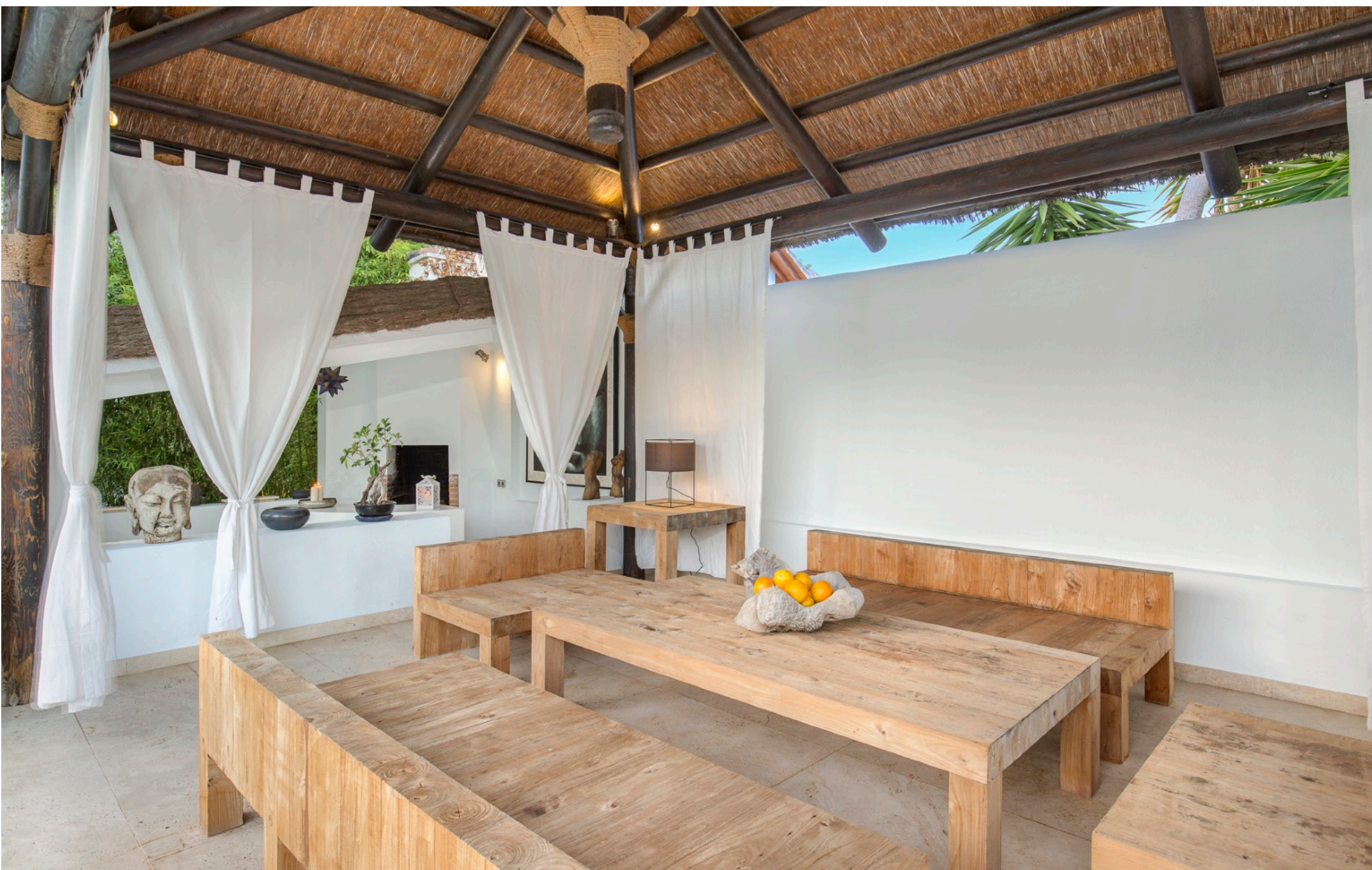
Casa de la Piscina