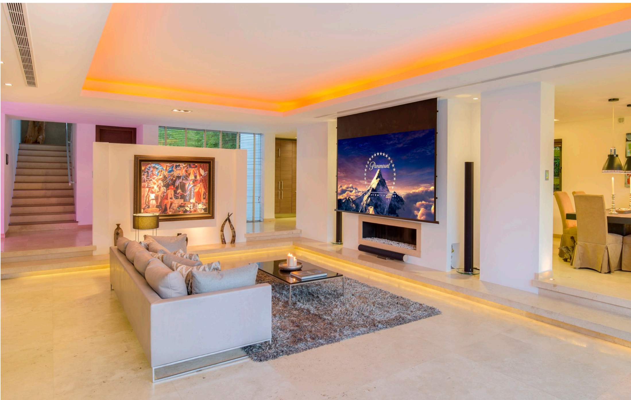
Salón Principal con Cine