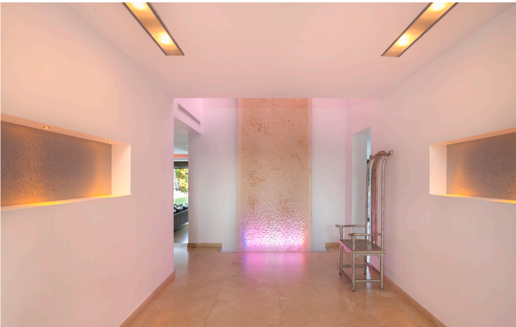
Pasillo de la Entrada