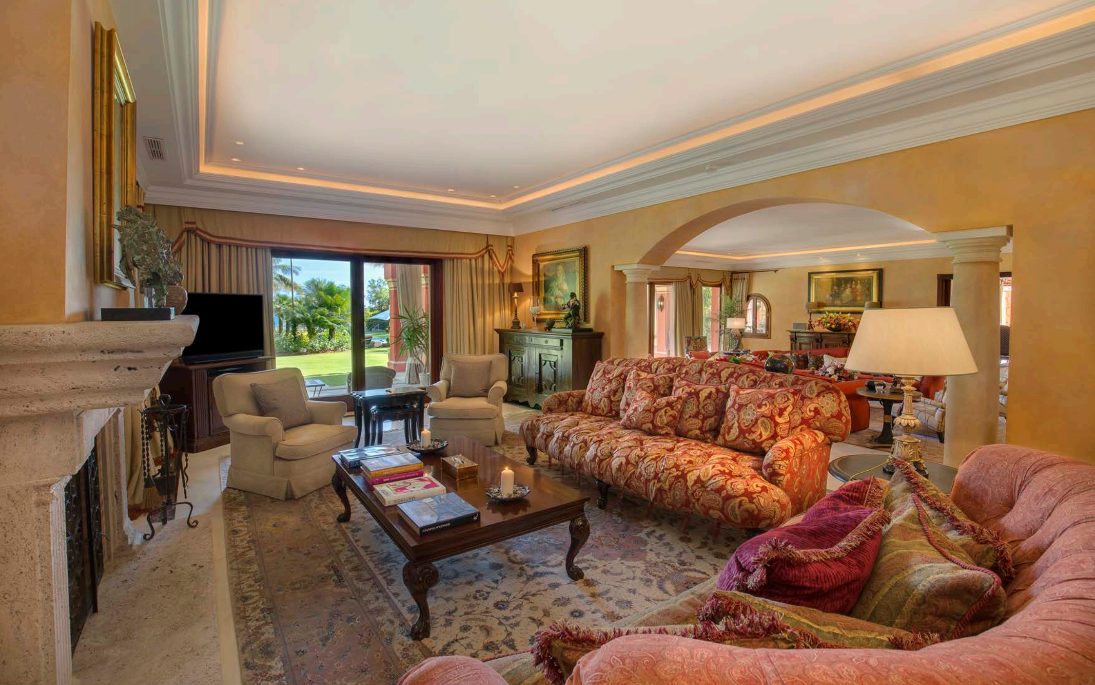
Salón de la Chimenea