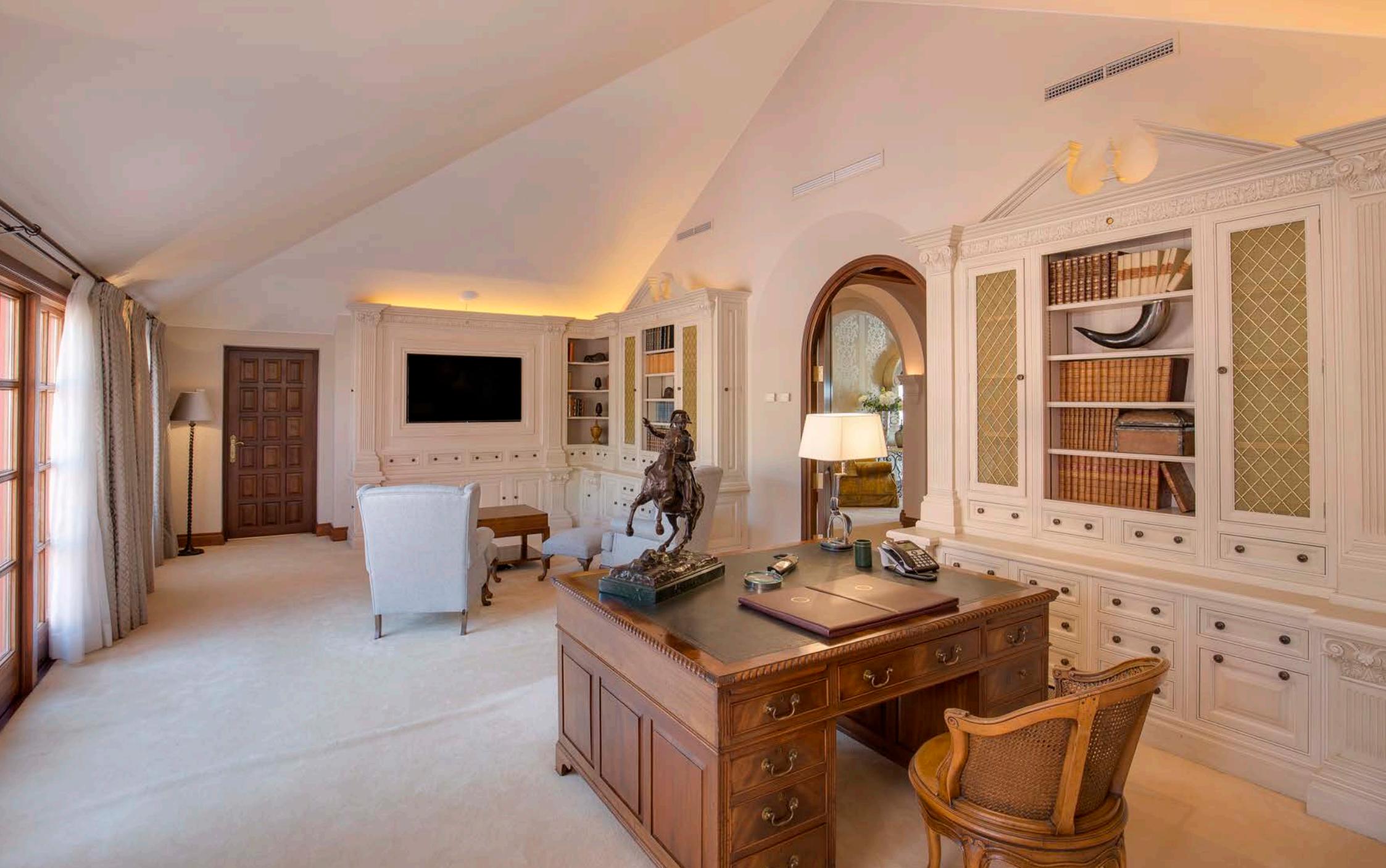
Oficina y Biblioteca del Dormitorio Principal