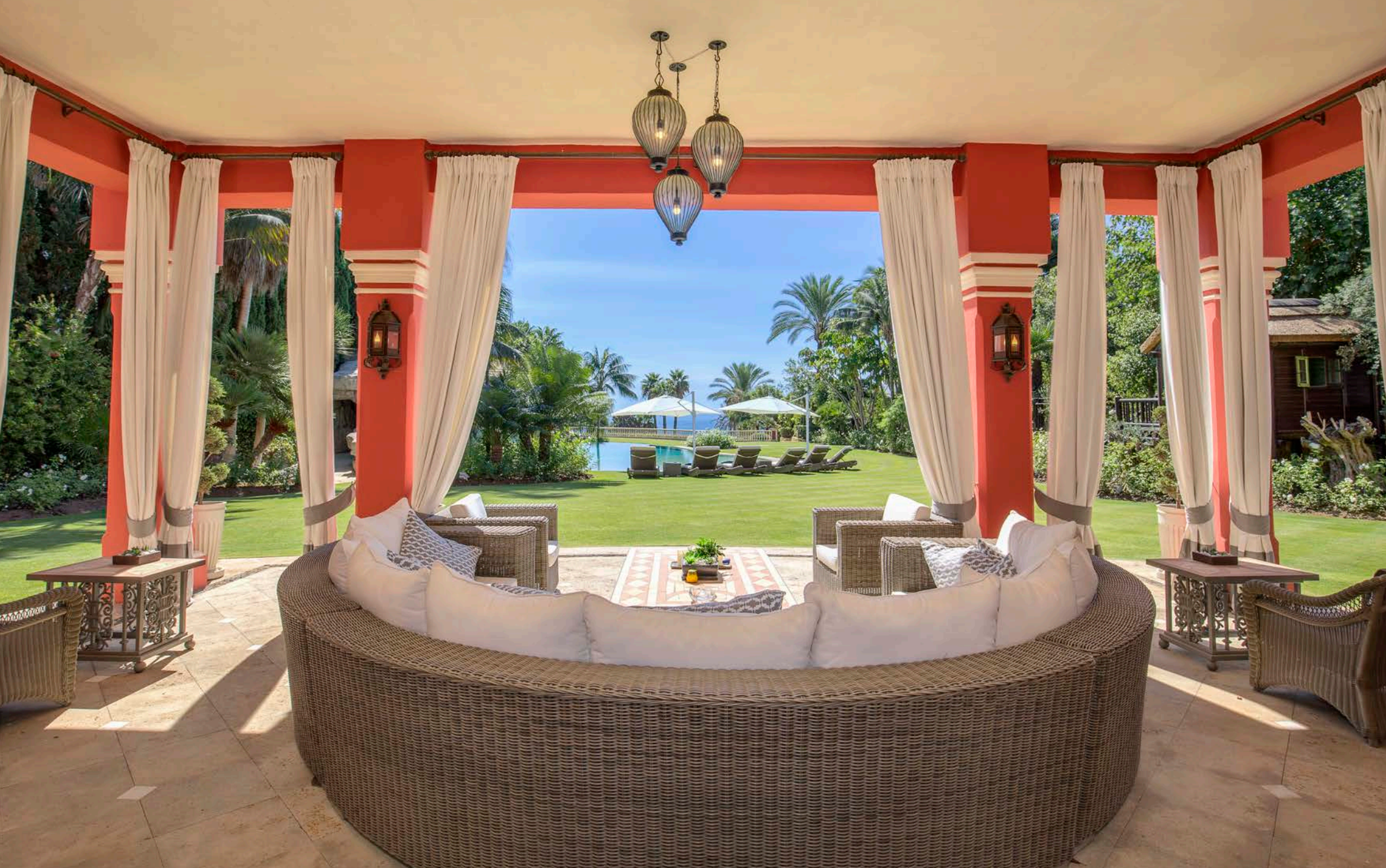
Zona Chill Out Exterior