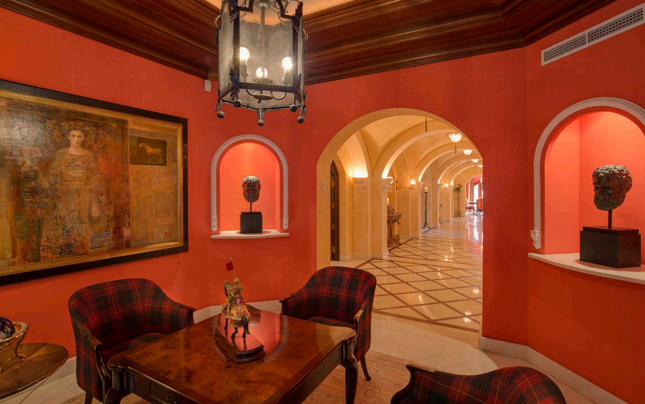
Sala de Juegos