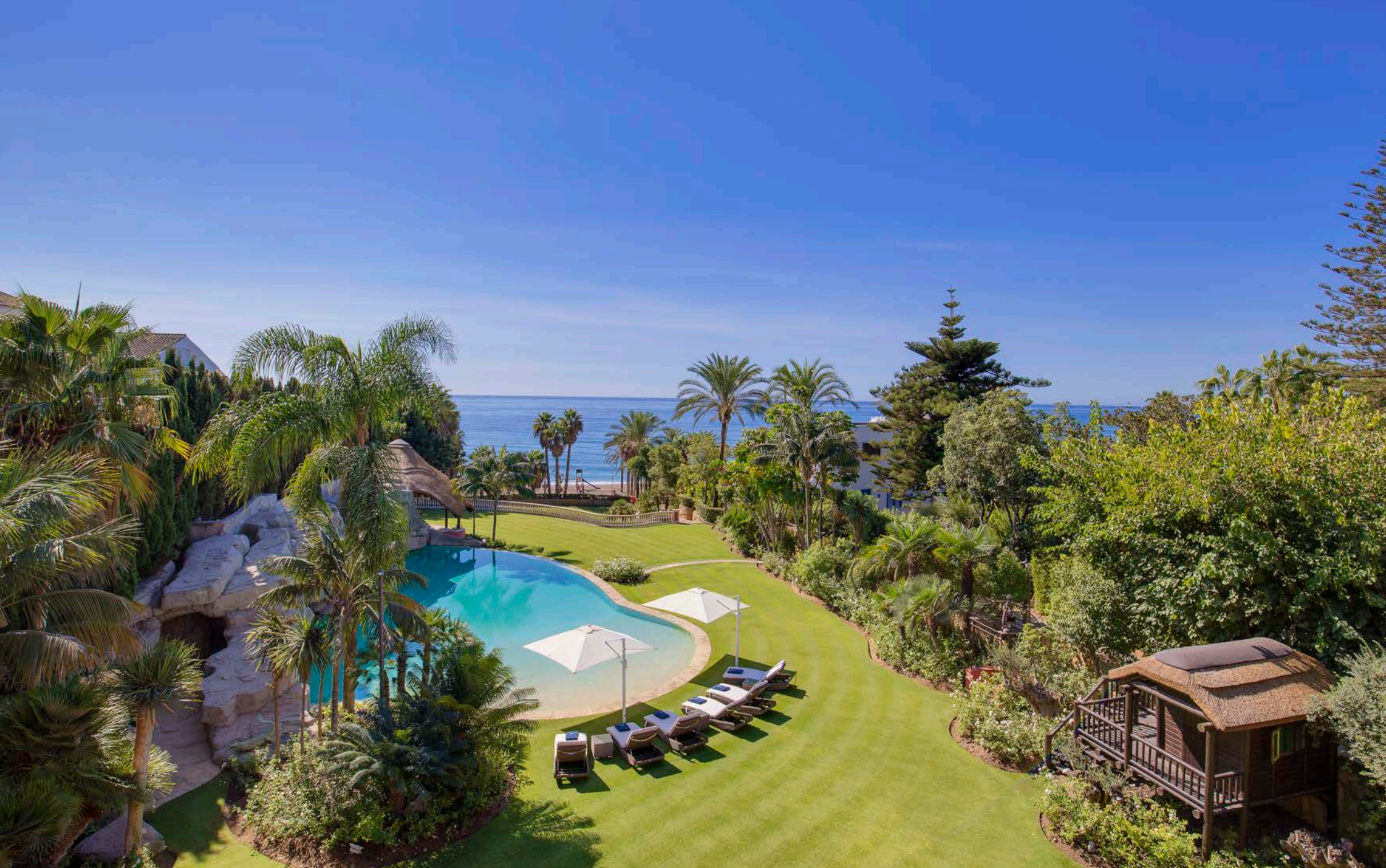
Maravillosas Vistas desde el Dormitorio Principal