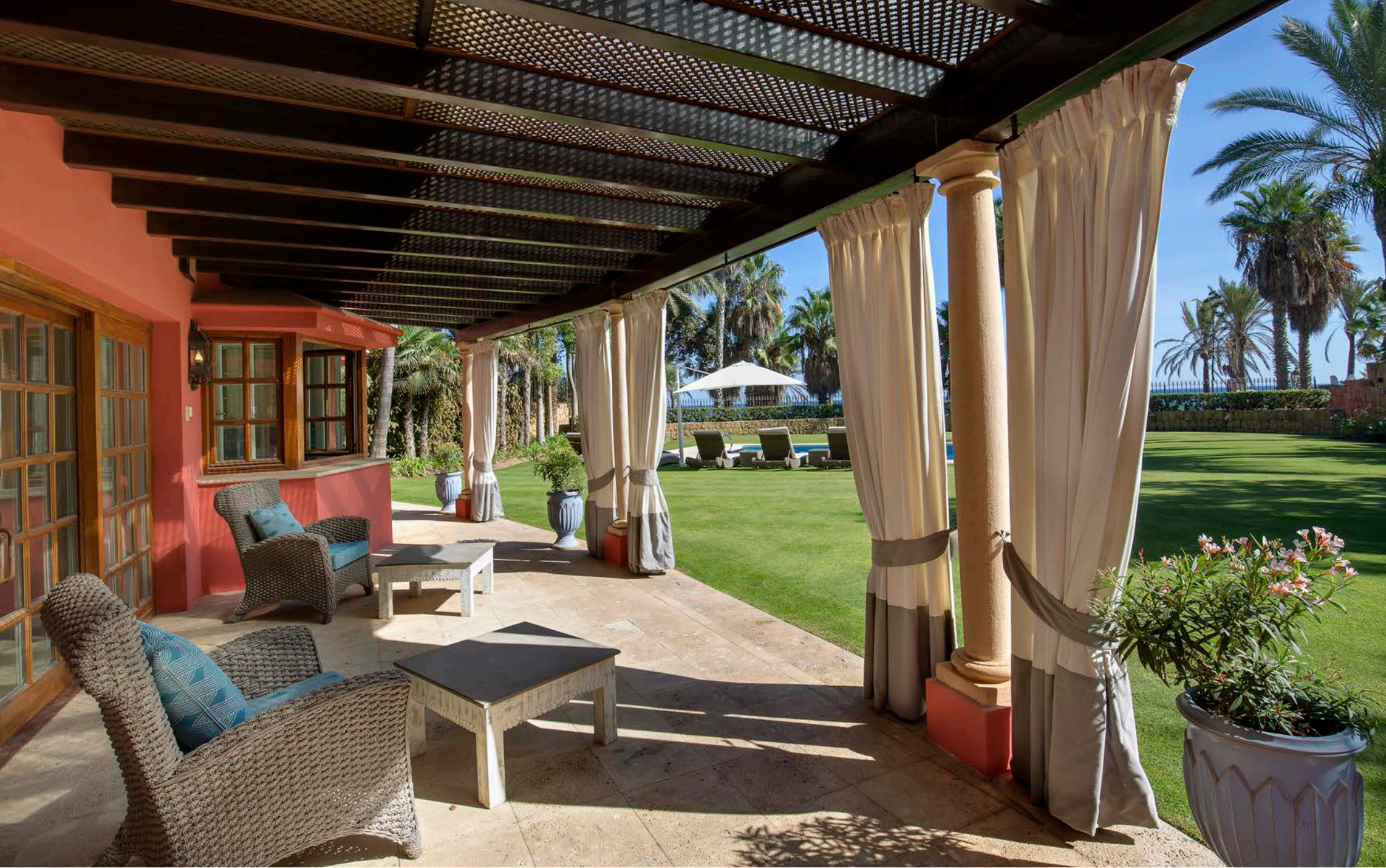
Zona Chill Out Exterior