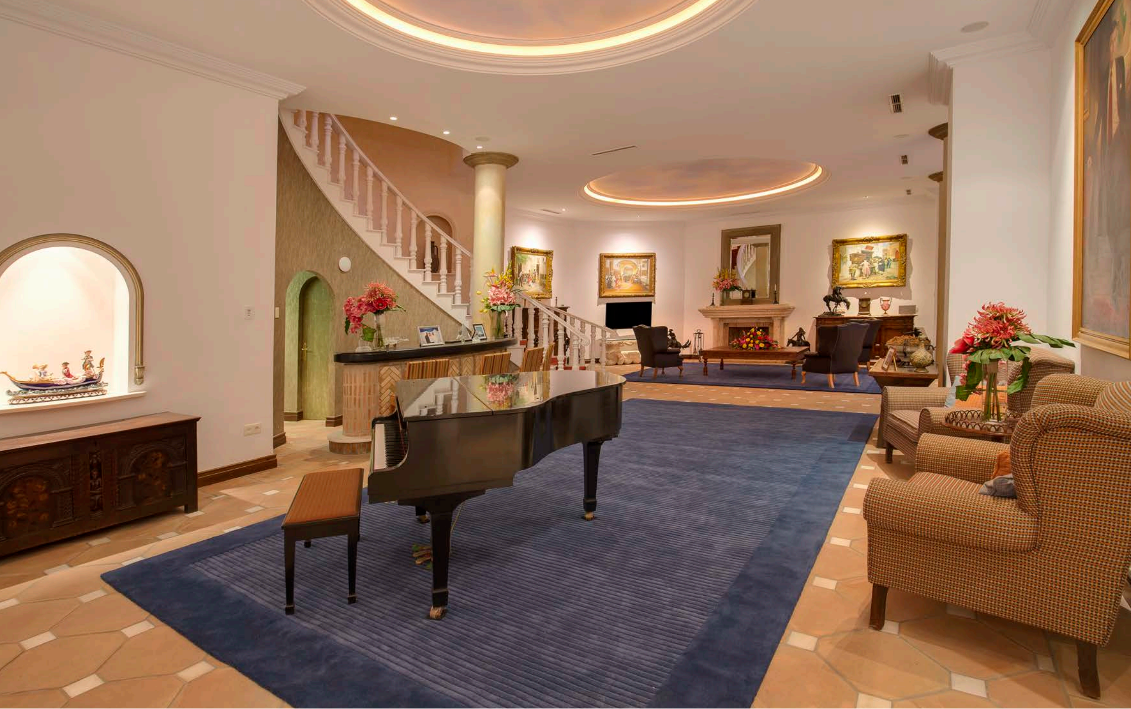
Sala de Música