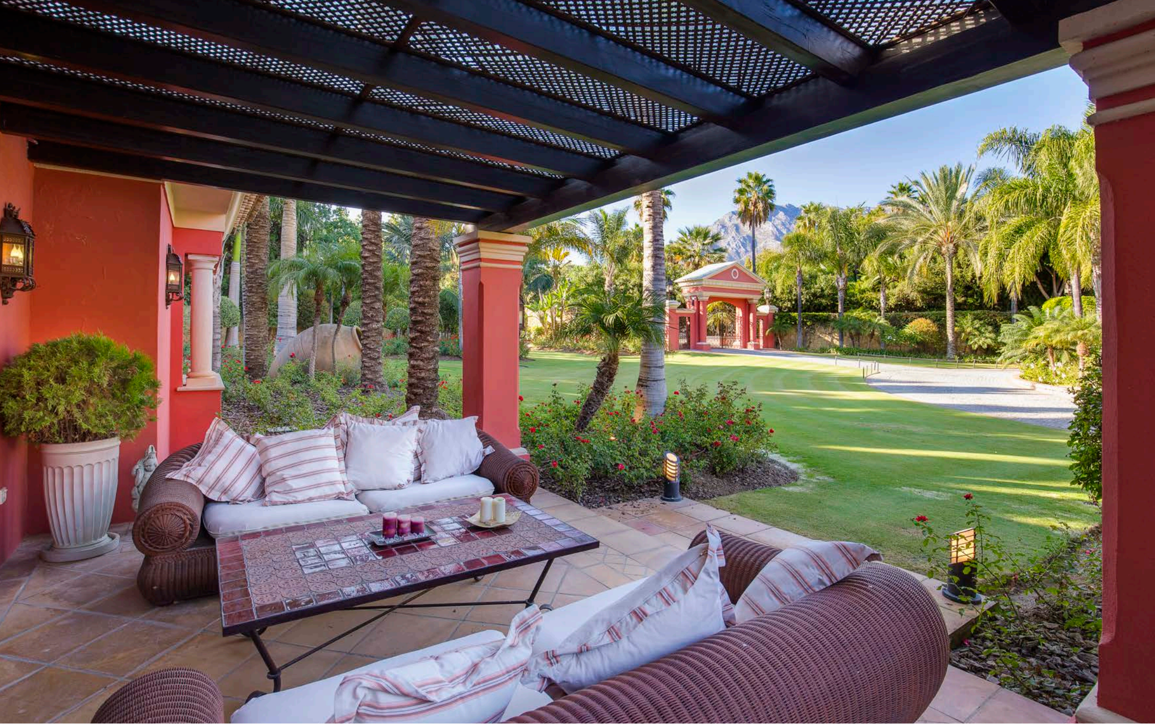
Zona Chill Out Exterior