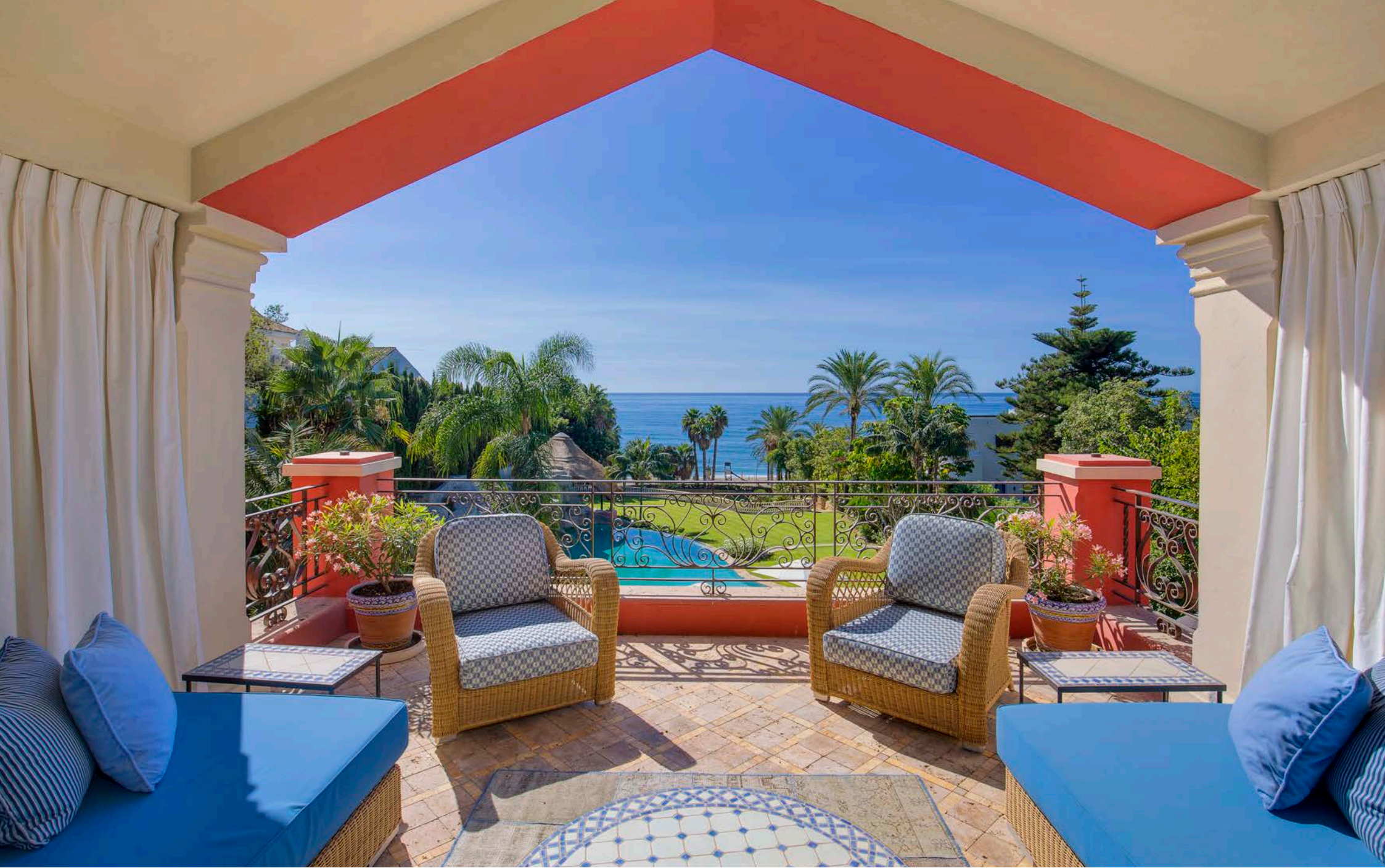
Terraza del Dormitorio Principal