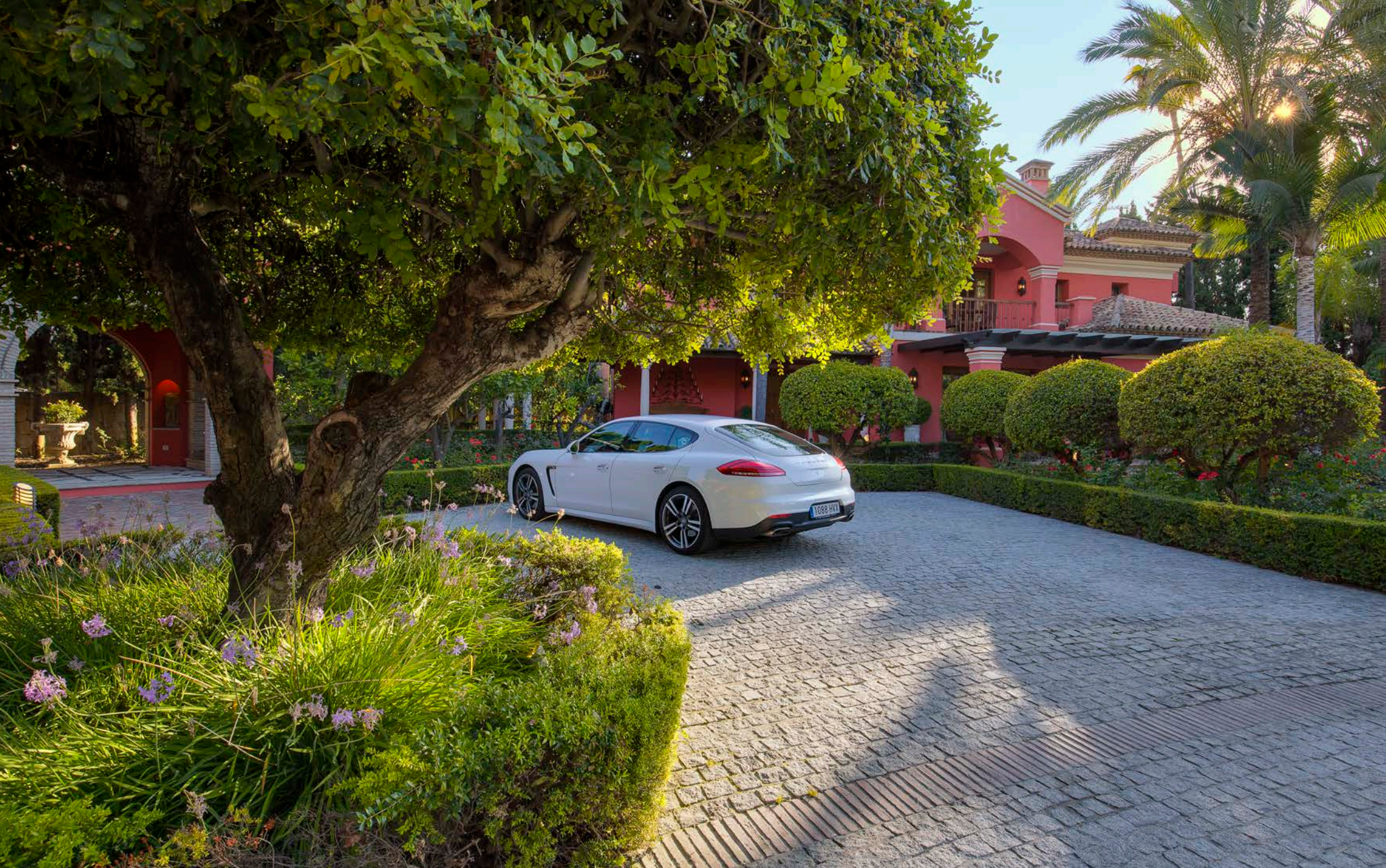
Parking de la Casa de Invitados