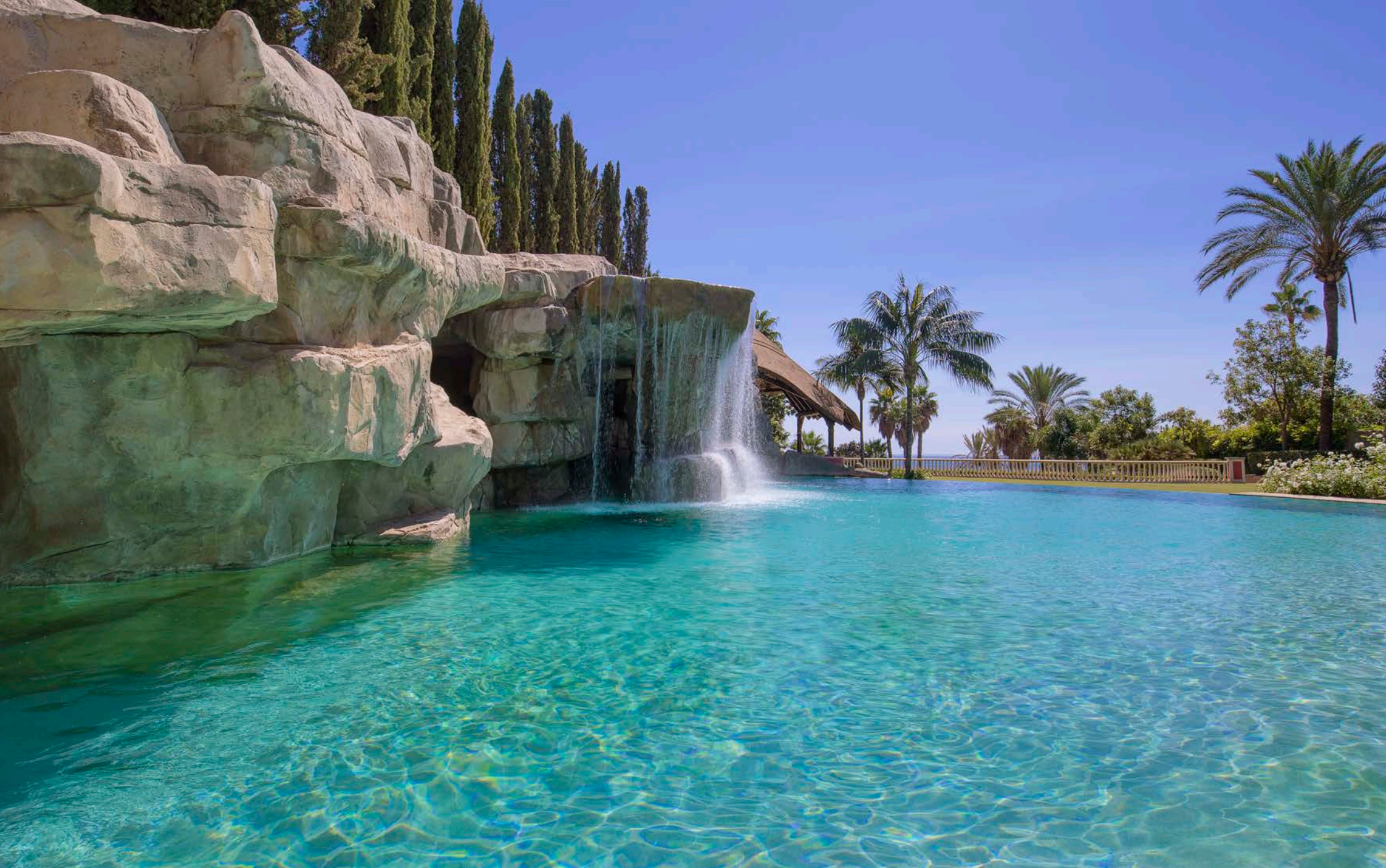
Piscina Exterior Principal